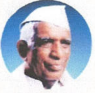
Founder President, Council of Education, Kolhapur