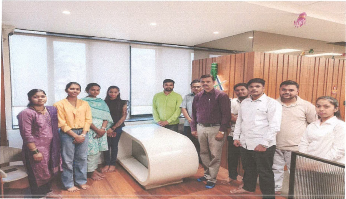
Students with Gavade Associate Staff